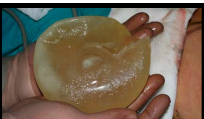
извадени импланти след 1.5 година. Някои са нбръчкани, други - разкъсани (горе)

ИМЕЙЛЪТ НА ФРЕНСКА АГЕНЦИЯ ЗА САНИТАРЕН КОНТРОЛ НА МЕДИЦИНСКИ ИЗДЕЛИЯ (AFSSAPS) Е DEDIM.UGSV@AFSSAPS.SANTE.FR